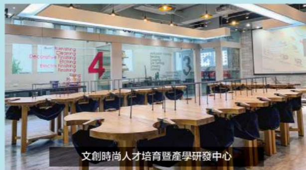
文創時尚人才培育暨產學研發中心