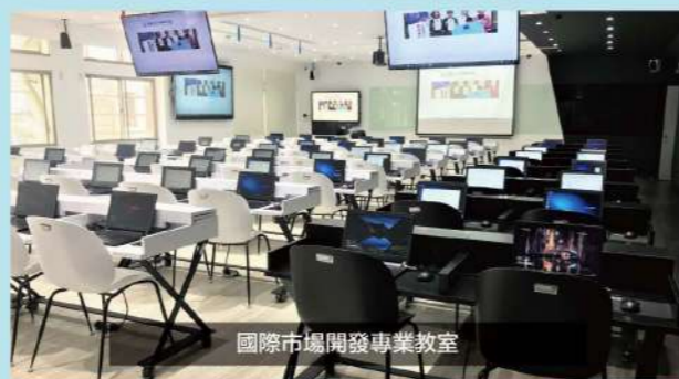
國際市場開發專業教室

歡迎到龍華首頁招生資訊：111進修部四技單獨招生，下載簡章與報名表，立即上網預約報名，免收報名費。