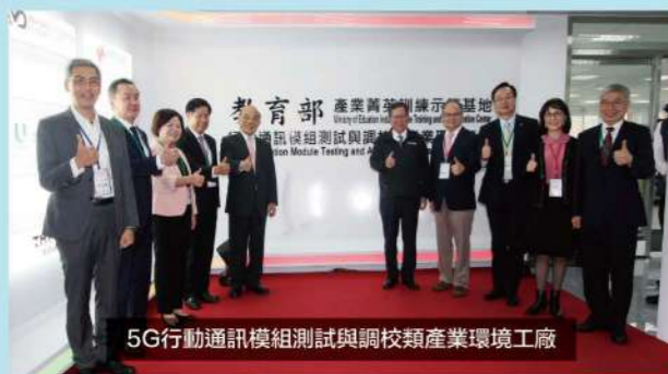
5G行動通訊模組測試與調校類產業環境工廠