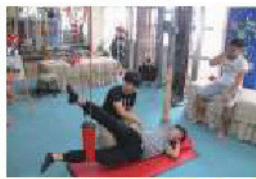
休閒運動與健康管理系