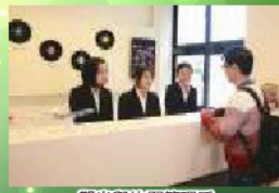
觀光與休閒管理系