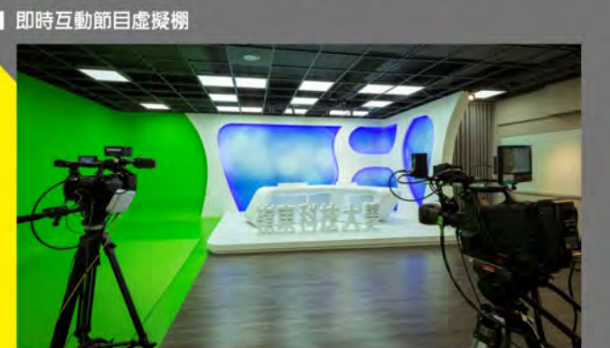
■ 即時互動節目虛擬棚