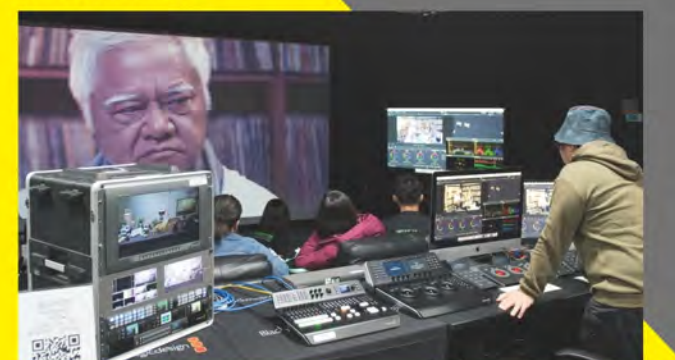
■ 數位剪輯與調光教室