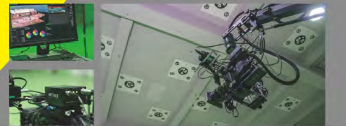
• 光學追蹤系統、電影高速攝影機、電動遙控機器手臂系統