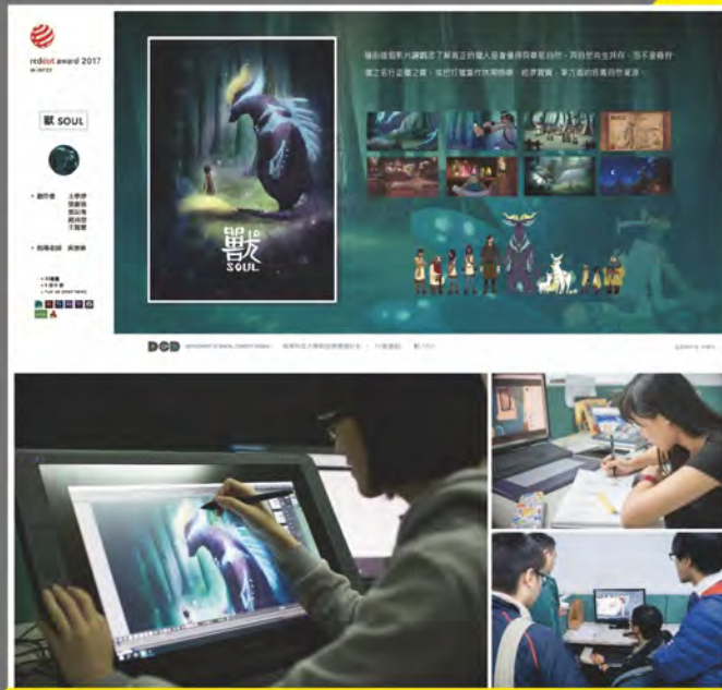
- 德國紅點設計獎得獎作品