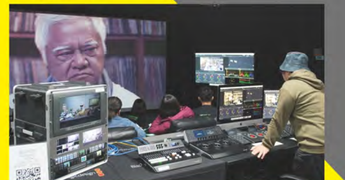
■ 數位剪輯與調光教室