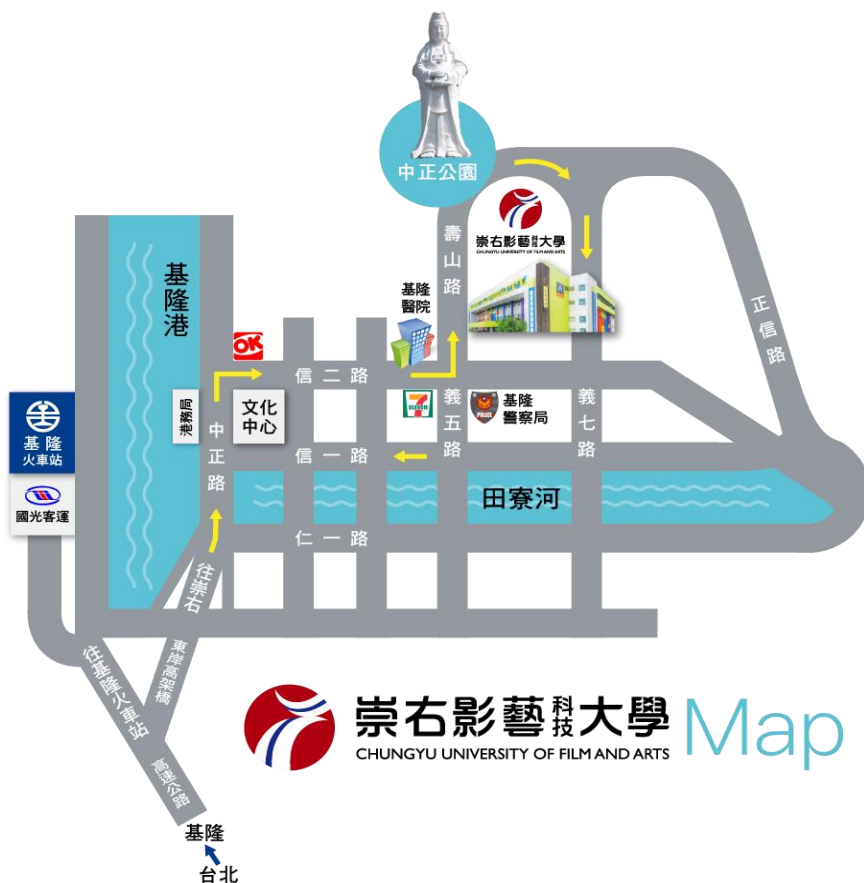
附件 8：崇右影藝科技大學位置圖