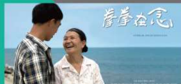
- 學生作品「調音師」屢創佳績，榮獲放視大賞

DEPARTMENT OF DIGITAL CONTENT DESIGN DCD