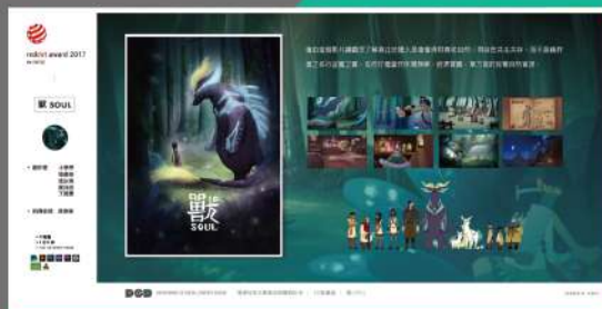
- 德國紅點設計獎得獎作品