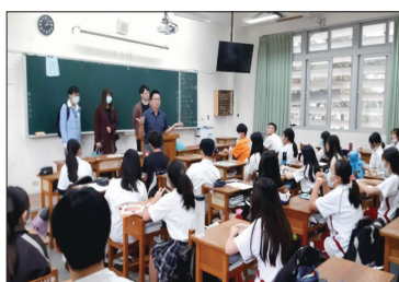
109學年度第2學期與嘉義市美術館 合作一校園美學推廣教育