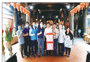
110年4月13日城隍廟統測祈福拜拜