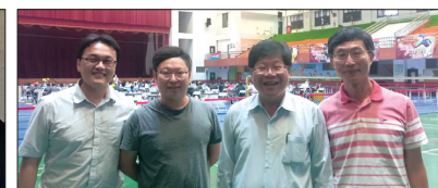
校長及實習主任蒞臨遠東科技大學與 機器人指導教師合影