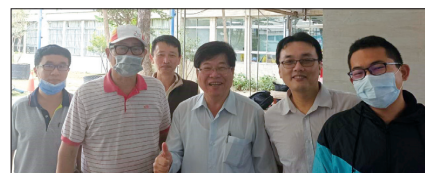
校長及實習主任至勞動部勞動力發展署 雲嘉南分署官田職業訓練場勉勵師生為校爭光