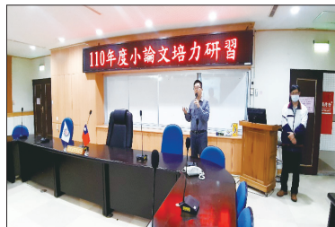
109學年度第2學期彈性課程教師研習— 小論文培力研習