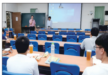
109學年度第2學期新課綱增能教師研習： 素養導向評量：從素養導向教學出發