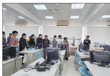
109學年度第2學期機器人社群研習