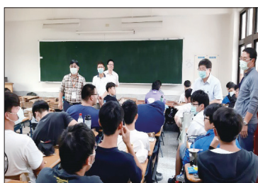
吳鳳科技大學統測考場— 校長、會長、主任替學生加油打氣