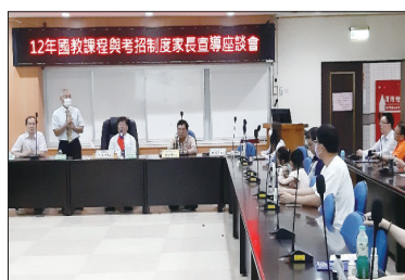
12年國教課程與考招制度 家長宣導座談會