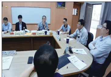
109學年度第2學期 第1場新課綱到校諮詢