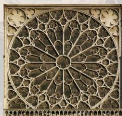
聖母院玫瑰窗外觀