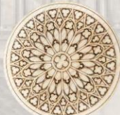
雷射雕刻作品-實木材質