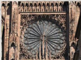
法國史特拉斯堡教堂玫瑰窗外觀