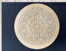
雷射雕刻作品-壓克力材質