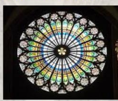
史特拉斯堡教堂玫瑰窗內部