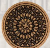
雷射雕刻作品-軟木材質