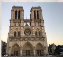
法國巴黎聖母院外觀

2007-2019期間，本科教師暑期前往歐洲奧地利、捷克、匈牙利、德國、法國及瑞士等國家，參觀過這些國家的著名教堂，例如:法國巴黎聖母院(Notre-Dame de Paris)、法國史特拉斯堡拉聖母教堂(Cathédrale Notre-Dame de Strasbourg)、布拉格聖維特教堂/St. Vitus Cathedral)、瑞士洛桑大教堂(Cathedral of Notre Dame of Lausanne)……等，對於教堂內玫瑰窗的造型深深著迷，更佩服數百年前設計玫瑰窗的建築大師或工匠的繪圖能力。自2020年起，本科教師嘗試在108新課綱立體雕塑課堂中，利用Inventor繪製玫瑰窗，經過不斷修正與反思，儘量抓住原玫瑰窗主要特徵與美感，在立體雕塑及電腦繪圖課程中加入玫瑰窗元素，學生不僅可以領略歌德建築之美，更能夠欣賞幾何圖形變化萬千，對於未來設計產品的能力必能有所助益。學生在任課教師教導之後，學生也能創作出自己獨樹一格的玫瑰窗，因此課程頗受學生喜愛。