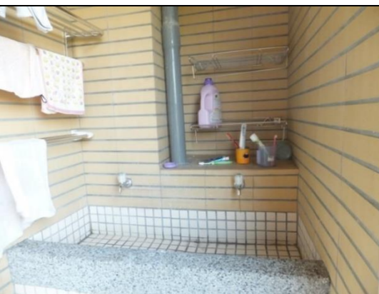
寢室設有洗衣台及曬衣空間