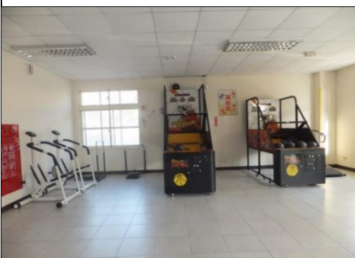
一樓設有電視、卡拉 OK、撞球桌、鋼琴、籃球機、健身器材