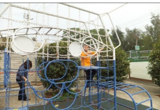
宿舍外有籃球場及遊樂設施