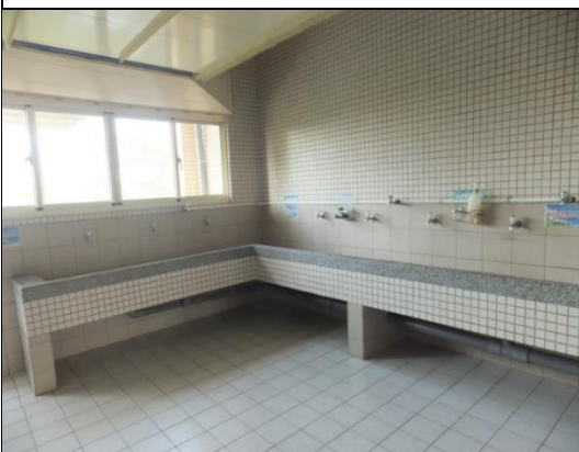
公共區設有洗衣空間和脫水機