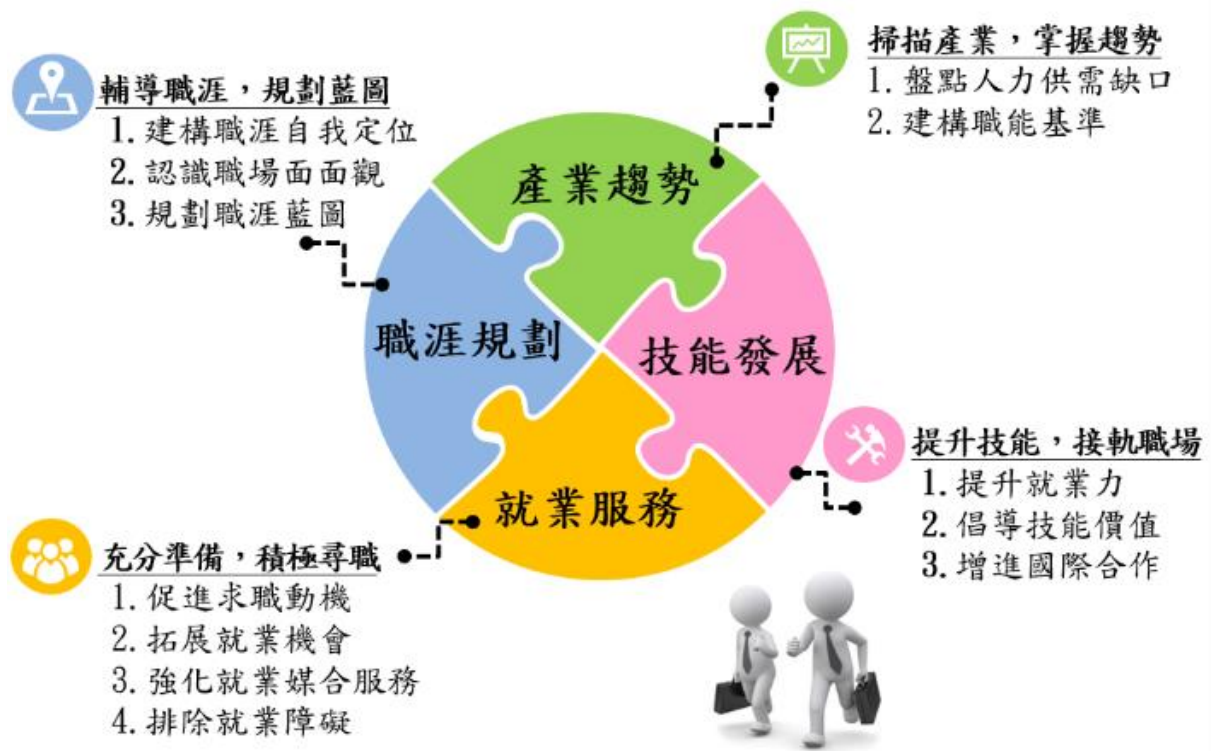
圖 1 投資青年就業方案策略圖