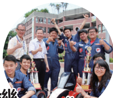
機械與自動化工程學系