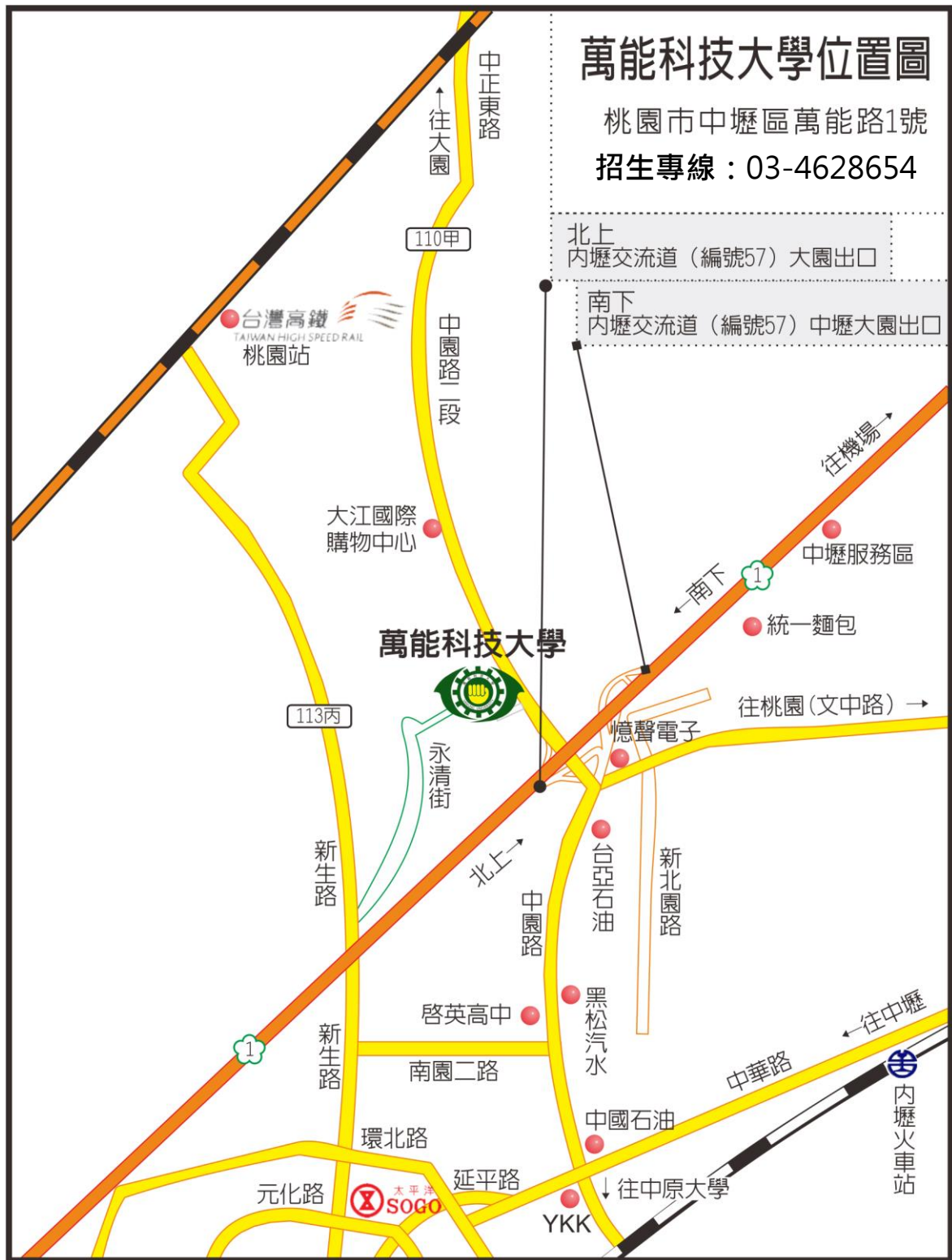
萬能科技大學位置圖：