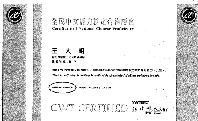
※高、優等證書證號示意圖