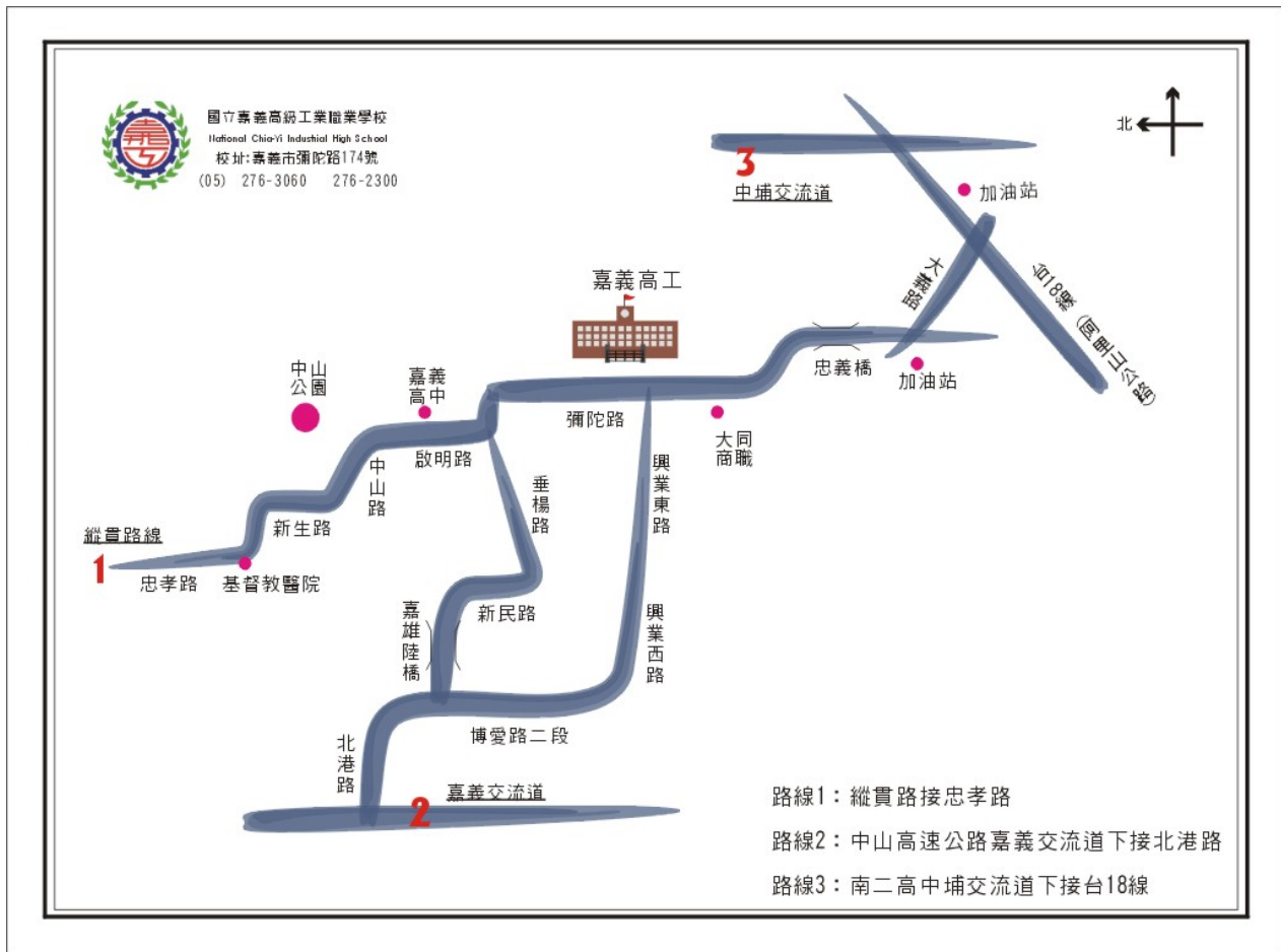
附圖一 承辦學校位置圖