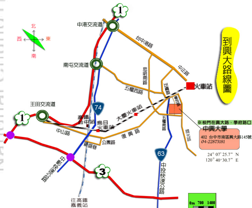
國立中興大學交通路線參考圖

(二)由 國道3號福爾摩沙高速公路 ： 209K 中投(台中)交流道下→接63線中投快速公路，往臺中市區方向→五權南路→忠明南路(右轉)→興大路(左轉)→中興大學。